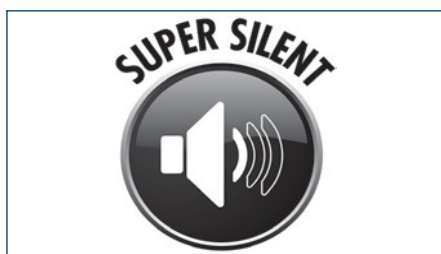
Super stille zuigmotor (voor 471 en 471 T) Moteur super silencieux (pour 471 et 471 T)