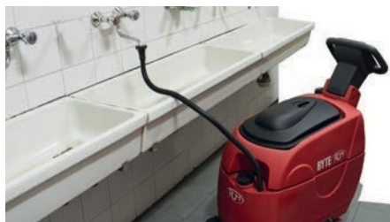
Waterslang Flexible d'eau