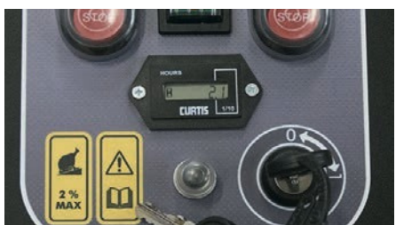
Urenteller (enkel voor 471 en 471 T) Compteur d'heures (pour 471 et 471 T)