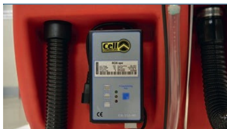
Ingebouwde batterijlader Chargeur de batterie incorporé